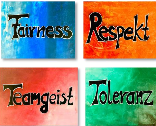
Projekt des Wahlpflichtkurses - Kunst klassisch und digital 8