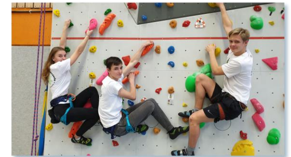
Kletter-AG an der eigenen Kletterwand