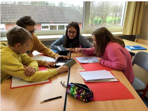
Projektunterricht mit integriertem Methodenunterricht